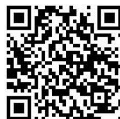
影片 QR CODE